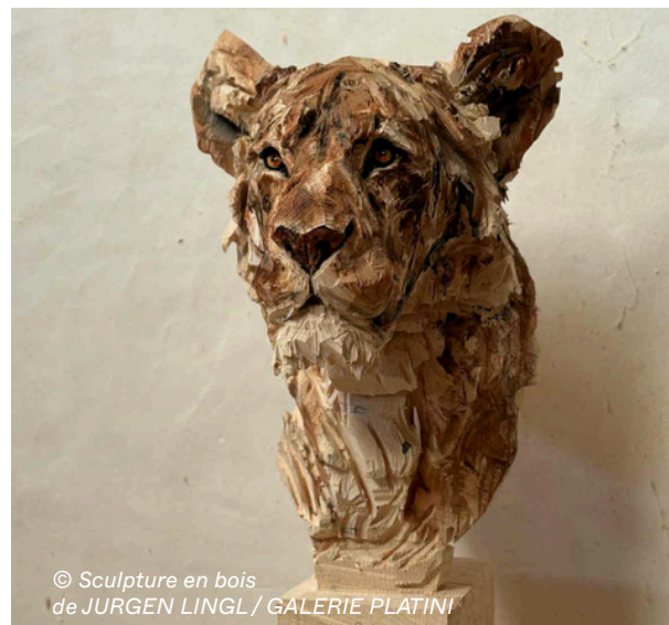
© Sculpture en bois de JURGEN LINGL / GALERIE PLATINI